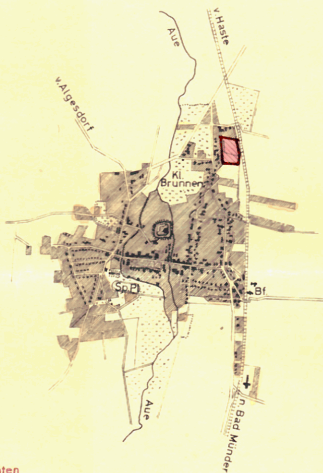
SITUATION IM MAßSTAB 1 : 25000