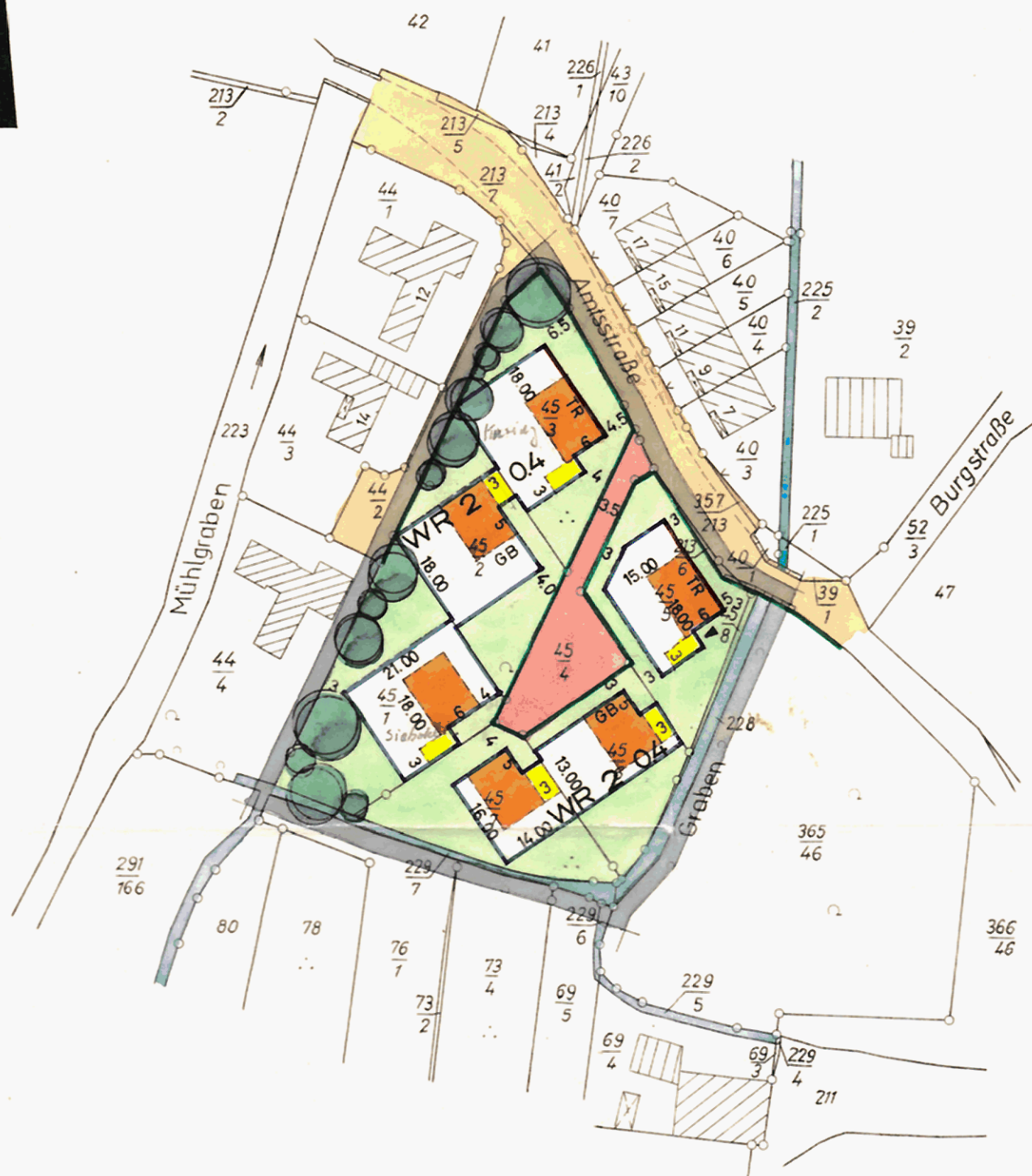
SITUATION 1 : 25 000