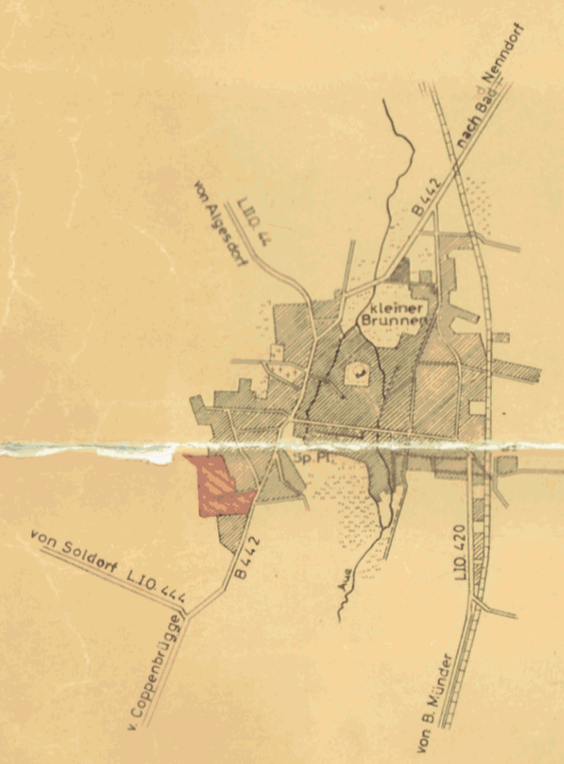
SITUATION IM MAßSTAB 1 : 25000

Die Richtigkeit der Planungsunterlage in vermessungstechnischer Hinsicht wird bescheinigt