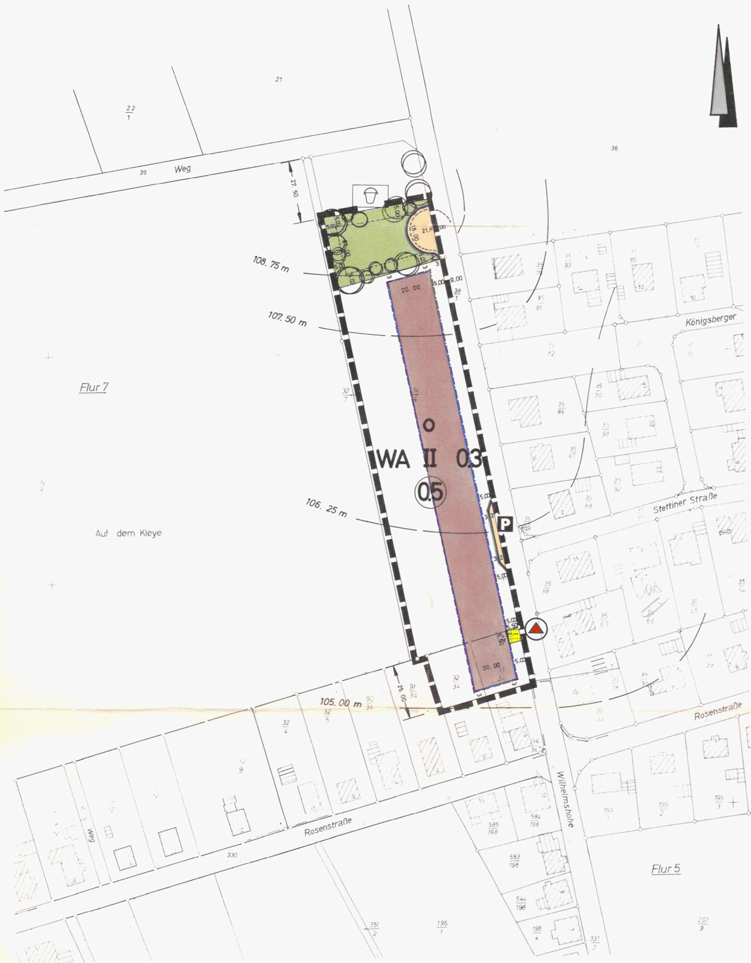
Übersichtsplan Maßstab 1:25 000