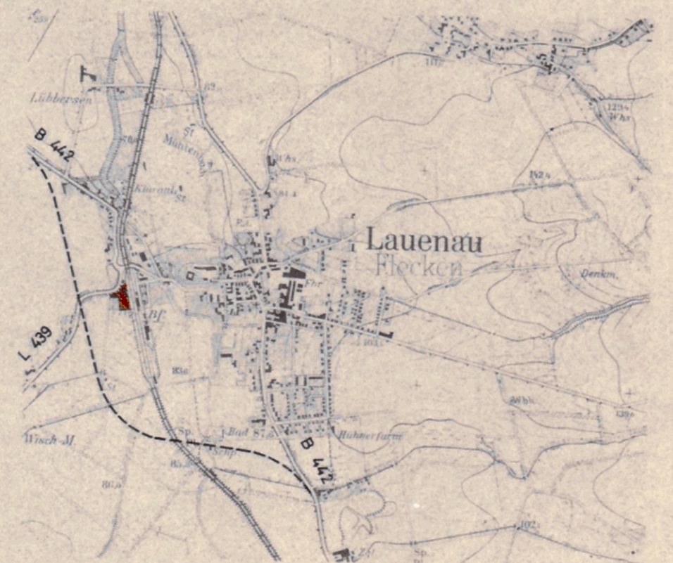
Ausschnitt aus der Topographischen Karte M.1:25000

Der Gemeindevorstand [Signature] Unterschrift