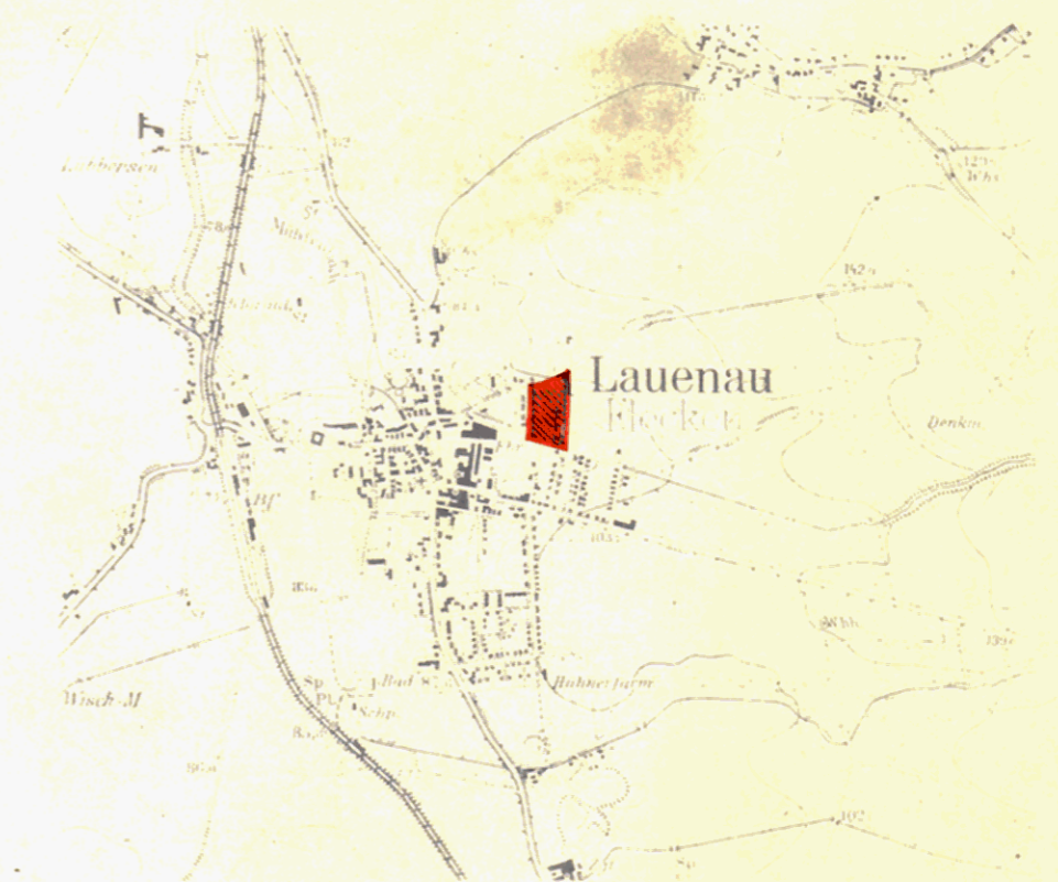
Ausschnitt aus der Top. Karte 1:25 000

PLAN - UNTERLAGE VERVIELFÄLTIGT MIT GENEHMIGUNG DES HERAUSGEBERS