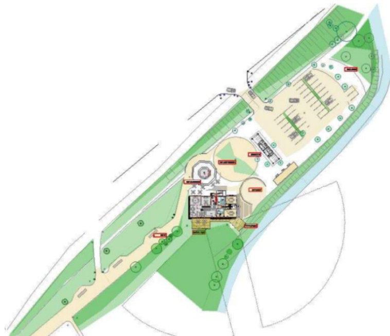
Abb. 5: Zum Ensemble „Kleiner Brunnen/Wäschehaus“ sinnhaft mit zu nutzenden Freiflächen.

Die Stadt Rodenberg beabsichtigt den Verkauf des Grundstücks nördlich und südlich des Ensembles, einschließlich des historischen und denkmalgeschützten Wäschehauses. Das Eigentum an dem denkmalgeschützten Kleinen Brunnen behält sich die Stadt Rodenberg vor und wäre entsprechend neu zu vermessen. In die Nutzungsüberlegungen kann auch die südlich gelegene Freifläche entlang der Allee mit einbezogen werden. In der Nähe der Straße „Allee“ befinden sich geringe Abstellmöglichkeiten für Fahrzeuge. Zur besseren Erschließung der Wohnquartiere wird eine Querungshilfe an der K53 in Höhe der Einfahrt „Allee“ zeitnah errichtet.