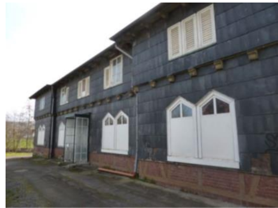
Abb. 2 und 3: Aktuelle Ansichten „Kleiner Brunnen“ (links) und „Wäschehaus“ (rechts).