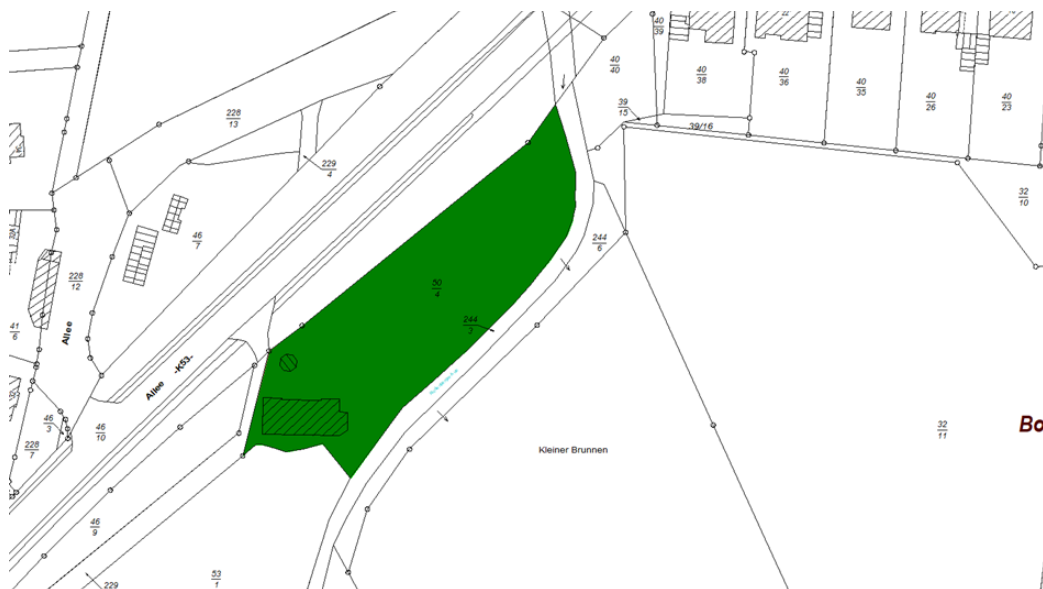
Abb. 4: Auszug aus der amtlichen Liegenschaftskarte.

Das Grundstück liegt in der Allee in Rodenberg am Ortsausgang in Richtung Bad Nenndorf und ist 3.999 m 2 groß, könnte aber ggfs. anders vermessen werden. Es ist in folgendem Ausschnitt aus der Amtlichen Liegenschaftskarte ersichtlich: